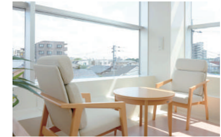
デイルームコーナー